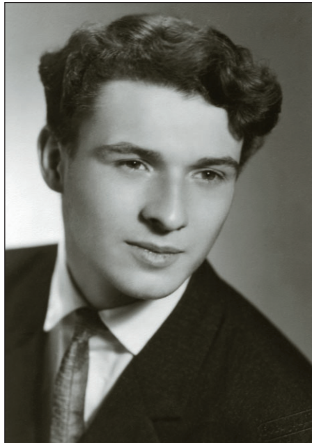
Fotografia de la examenul de maturitate a lui Jan Palach, 1966 (ABS)