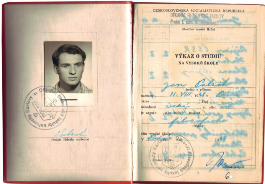
Carnetul de student lui Jan Palach de la Facultatea de Filozofie a Universității Caroline, toamna lui 1968