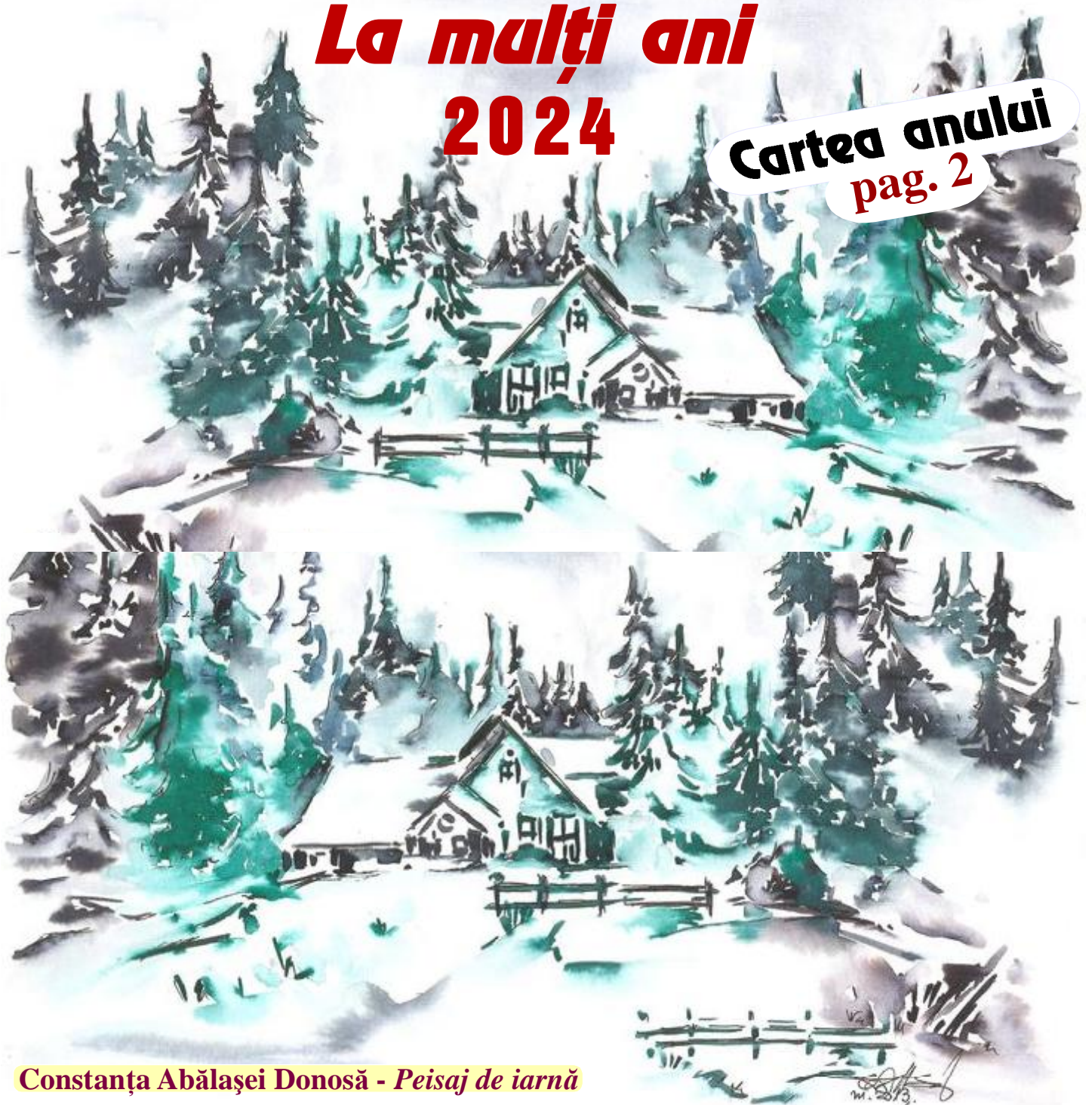
Constanța Abălașei Donosă - Peisaj de iarnă