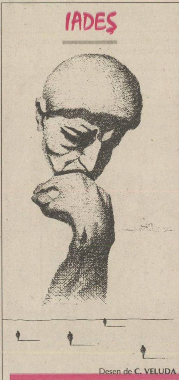
Desen de C. VELUDA

P.S. Își dorea să fie înmormântat acasă. Ar fi păcat să nu apară oferte din partea unor persoane sau instituții care pot asigura suportul necesar pentru transportul în țară.